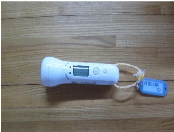
貸出：非接触型体温計6台所有