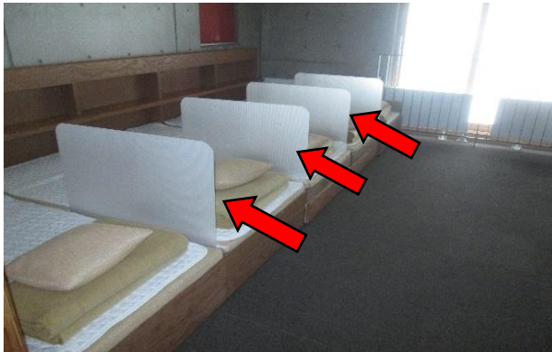
宿泊棟：ベッドとベッドの間のパーテーション