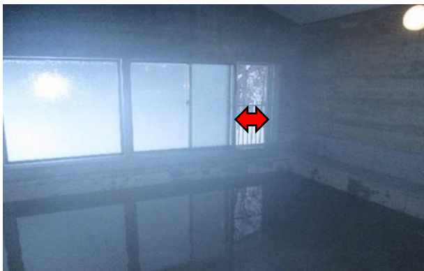
浴場：定期的な換気（常時換気を推奨）