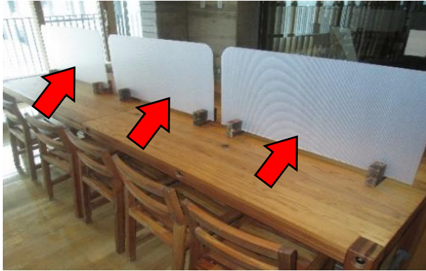
食堂：テーブルパーテーション設置