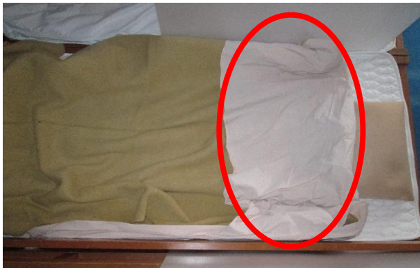
寝具：シーツは首元の両側を縫い感染予防対策