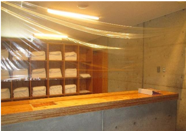
リネン室：飛沫防止用ビニールシートの設置