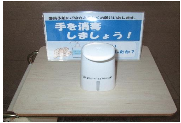
館内：消毒ディスペンサー6台所有