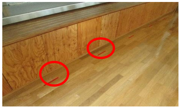
食堂：ソーシャルディスタンスの確保、対面にならないような体の向きの設定