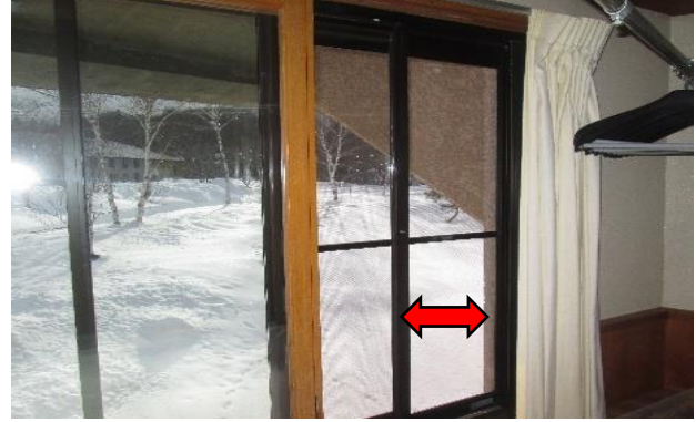
宿泊棟：定期的な換気（常時換気を推奨）