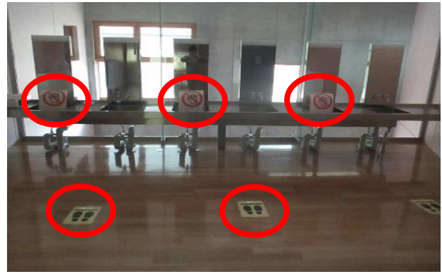
手洗い場：ソーシャルディスタンスの徹底（掲示）