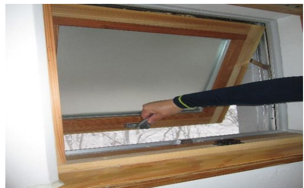
脱衣所：定期的な換気