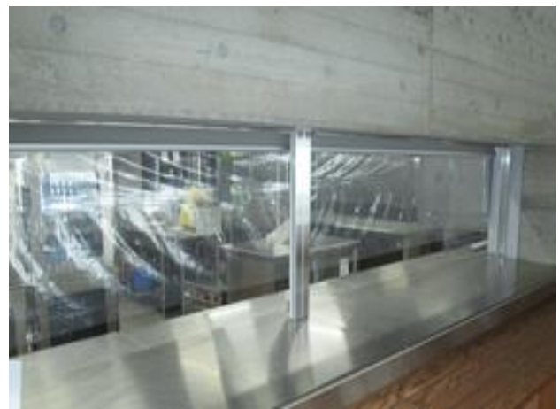
食堂：飛沫防止用ビニールシートの設置