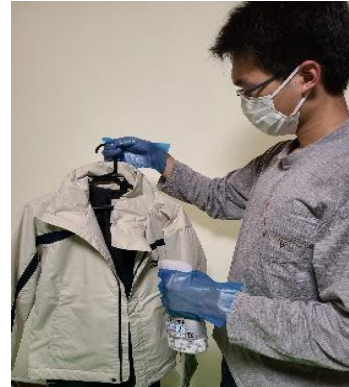
スキーウェア使用後除菌処置後3日間保管