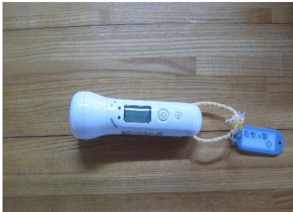
貸出：非接触型体温計6台所有