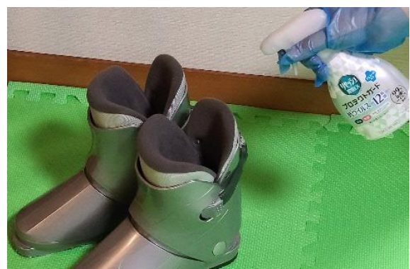
スキーブーツ使用后除菌処置後3日間保管