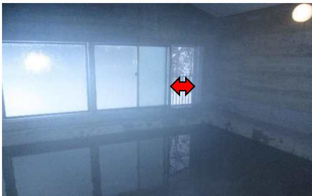
浴場：定期的な換気（常時換気を推奨）