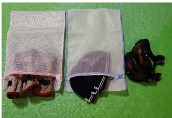
グローブ、キャップは使用后、すべて洗濯