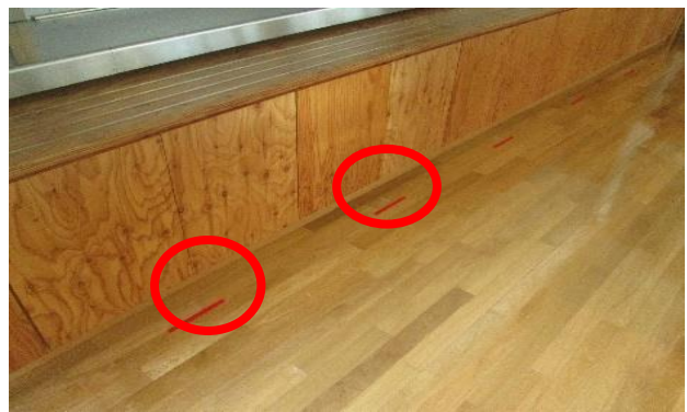
食堂：ソーシャルディスタンスの確保、対面にならないような体の向きの設定